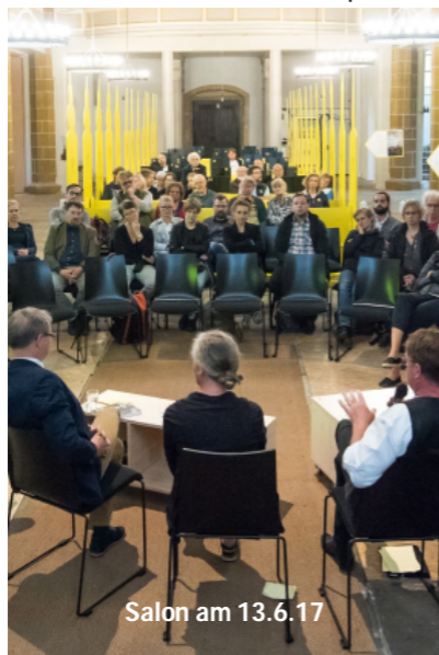
Salon am 13.6.17

500 Jahre Reformationsgeschichte fanden in der Jahreszahl 2017 einen Brennpunkt. Die individuelle